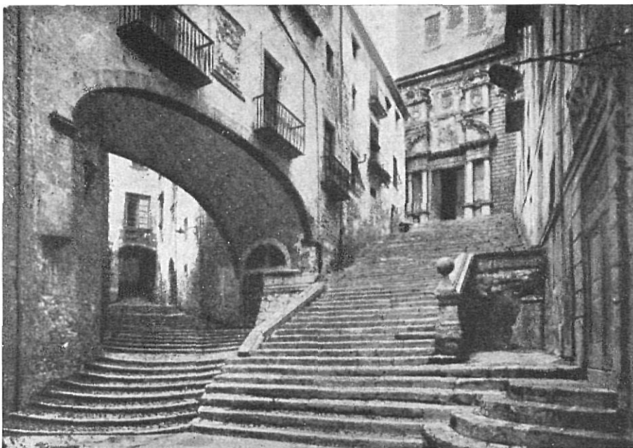
Pujada de Sant Domènec